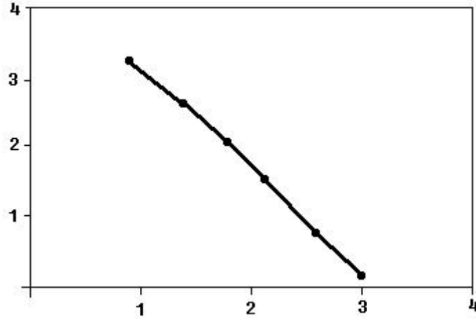
X 轴：MFI 值 Y 轴：标准品的浓度 检测试剂盒标准曲线